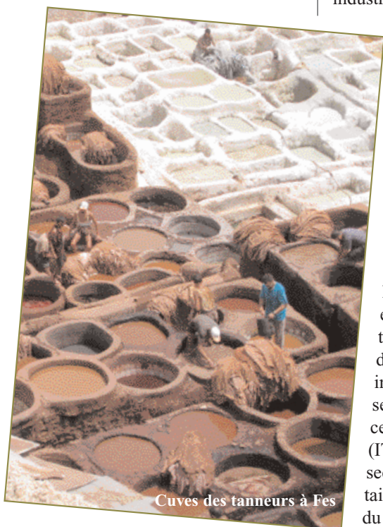
Cuves des tanneurs à Fes

Il apparaît clairement que dans l'entreprise marocaine, l'apprentissage de l'intelligence économique passe et passera encore longtemps par la pratique de veille et de la veille stratégique, comme c'est le cas en Europe. L'étude montre que les responsables de PMI ont conscience que l'information est un déterminant désormais clé pour le développement de l'entreprise et que la pratique de la veille devient incontournable. Mais, les pratiques liées à l'information demeurent non structurées et les pratiques de la veille aléatoires, peu formalisées. Les moyens, l'organisation et les outils font défaut. Les avancées semblent plus significatives dans les grandes structures, notamment du secteur bancaire. Le groupe ONA conduit une démarche d'introduction de l'intelligence économique dans l'entreprise s'appuyant sur une dynamique de management des compétences et chez Barid Al-Maghrib (la poste) la démarche de veille stratégique est pilotée à partir des orientations du plan stratégique 2003-2008. La banque BMCE entend se doter d'un département d'intelligence économique, dont la vocation est clairement l'analyse des concurrents et l'anticipation des risques. La Caisse des dépôts marocaine s'est doté d'un Institut en charge de la prospective et de la veille.