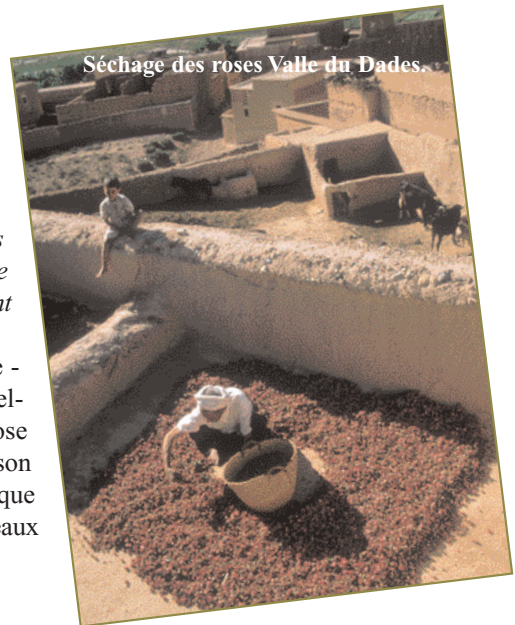
Séchage des roses Valle du Dades.

L'Institut Marocain de l'Information Scientifique et Technique (IMIST) a effectué ce qui est peut-être considéré comme la première enquête sur les besoins en information scientifique et technique et la pratique de la veille des entreprises de cinq secteurs des industries de transformation (le secteur des industries du textile, celui de l'habillement et du cuir (ITHC), et 32 PMI exportatrices du secteur des industries agro-alimentaires (IAA) situées dans la Région du Grand Casablanca). (11)